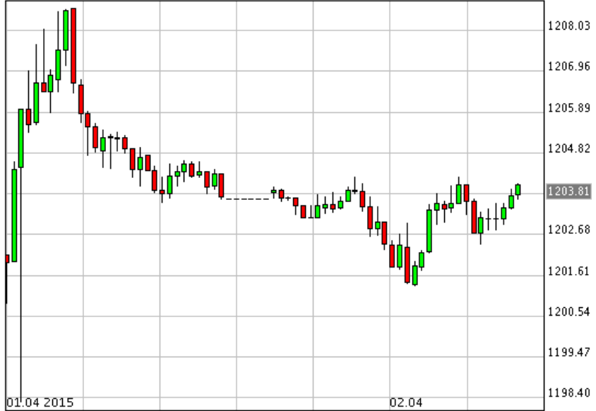
*XAU/USD_Bid 10 min