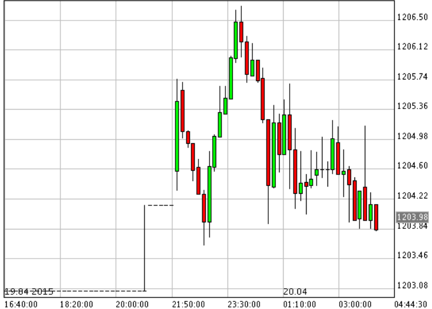
*XAU/USD_Bid 10 min

*SPDR ซื้อทอง 2.98 ตัน รวมถือครอง 739.06 ตัน