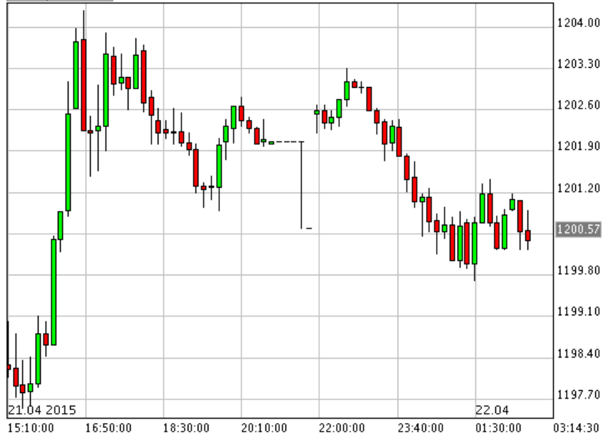
*XAU/USD_Bid 10 min

*SPDR ซื้อทอง 3.29 ตัน รวมถือครอง 742.35 ตัน