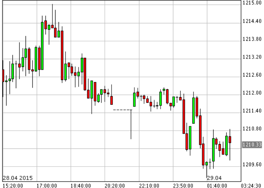
*XAU/USD_Bid 10 min