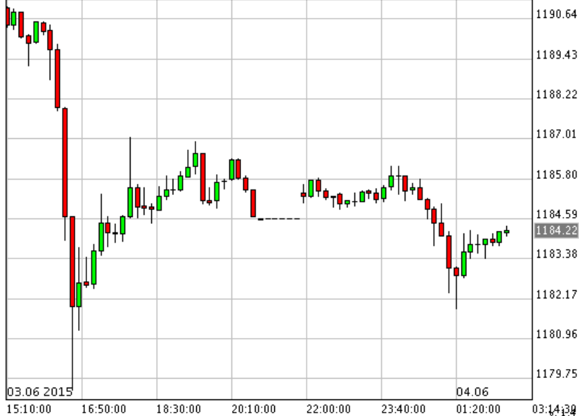
*XAU/USD_Bid 10 min