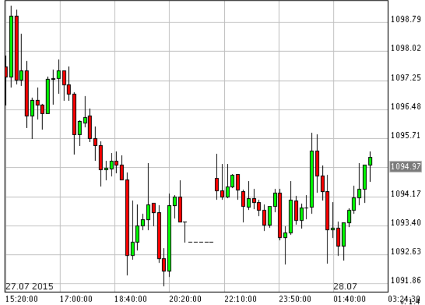
*XAU/USD_Bid 10 min