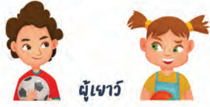
ผู้เยาว์

✅ ถ้าไม่ใช้การใด ๆ ที่ผู้เยาว์อาจให้ความยินยอมโดยลำพังได้ ต้องได้รับความยินยอมจากผู้ใช้อำนาจปกครองที่มีอำนาจ กระทำการแทนผู้เยาว์ด้วย