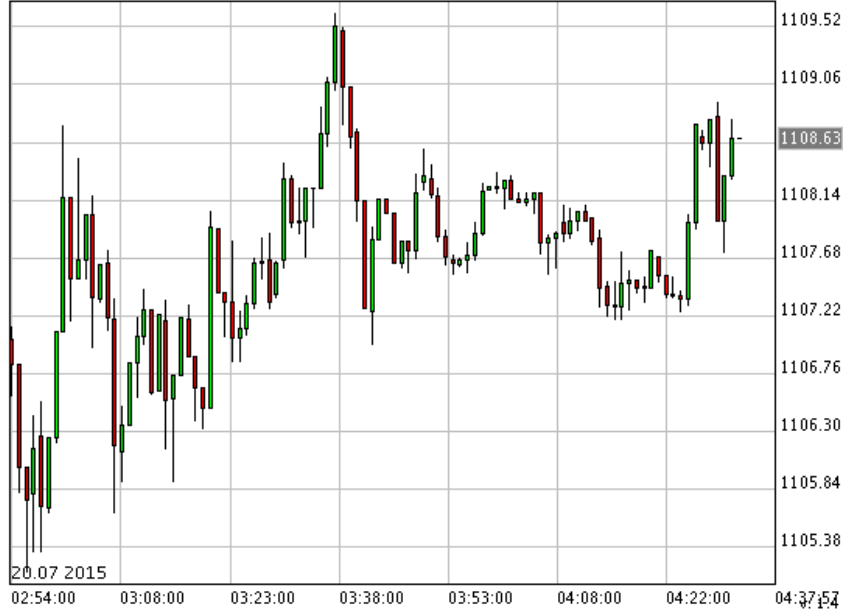
*XAU/USD_Bid 1 min

*SPDR ขายทอง 11.63 ตัน รวมถือครอง 696.25 ตัน