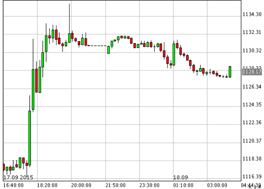
*XAU/USD_Bid 10 min