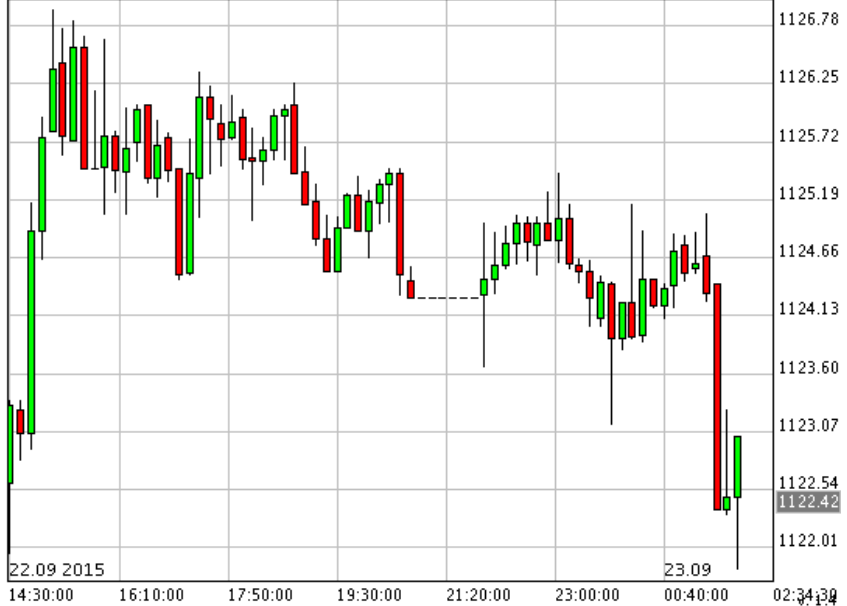
*XAU/USD_Bid 10 min

*SPDR ซื้อทอง 1.19 ตัน รวมถือครอง 675.80 ตัน